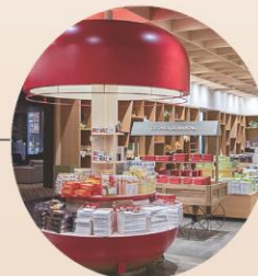
しらかばマルシェ