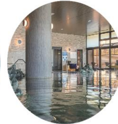
天然温泉 湖天の湯「石の湯」