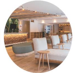
湯上がりラウンジ