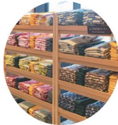
色浴衣コーナー 新本館にご宿泊の方無料レンタル