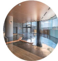
天然温泉 湖天の湯「木の湯」