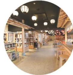
しらかば仲見世 売店・軽食・緑日広場