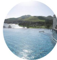
湖畔混浴「空」 湯み着用の混浴エリア