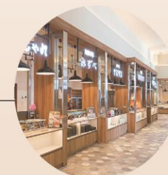
レストラン湖畔の風